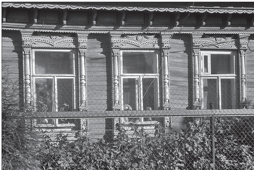
Рис. 2 Сельский дом, перевезенный в город. Фрагмент фасада

По мере приближения к современной эпохе все более ощущается субъективность и противоречивость оценок наследия. Впрочем, в этом мы ничуть не уступаем нашим предкам. А.А. Формозов на многочисленных примерах демонстрирует «разнородное теоретическое наследие в области охраны памятников, оставленное старой Россией новой послереволюционной эпохе» 9 .