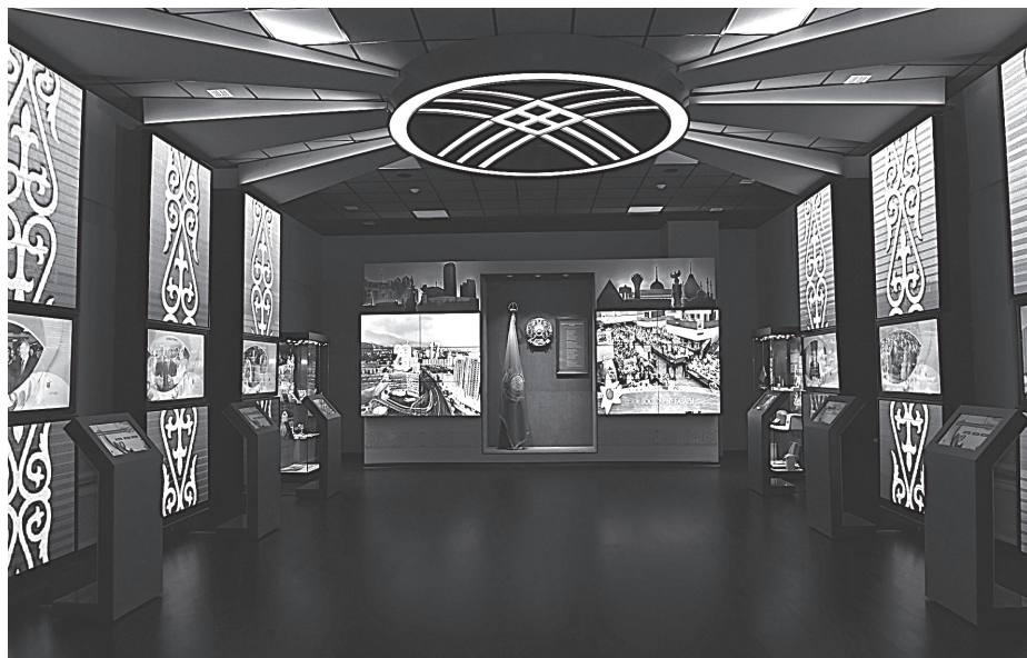
Рис. 3 Зал Независимости

общенационального согласия вносит Ассамблея народа Казахстана. Деятельность Ассамблеи народа Казахстана способствует росту международного авторитета Казахстана как страны, эффективно решающей проблемы межнациональных отношений. В марте 2018 г. Музей города Алматы совместно с Объединением «Қоғамдық келісім» («Общественное согласие») начал презентацию серии выставок «Ел бірлігі — достықта» («В единстве наша сила»), посвященных деятельности национальных культурных центров, в городе их насчитывается более 30. В зале Ассамблеи народа Казахстана Музея Алматы проведены 14 выставок-презентаций русского, бурятского, осетинского, афганского, крымскотатарского, чечено-ингушского, белорусского, украинского, туркменского, корейского, татарского, турецкого, дагестанского национально-культурных центров, а также Союза казаков Семиречья. На выставках были представлены экспонаты из фондов Музея Алматы, а также этнографический материал, книги, фотографии национально-культурных центров города Алматы. В презентациях выставок участвовали руководители национально-культурных центров, представители аппарата Акима города Алматы, общественность, художественные коллективы города. Материалы о мероприятиях были отражены в республиканских СМИ.