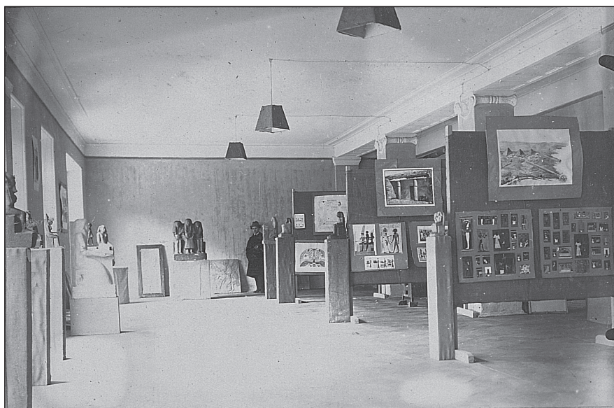
Рис. 2 Музей сравнительного изучения религий Ленинградского Губполитпросвета. 1924. ГМИР КП-49897

половине 1930 г. ЛАМ был объединен с областным Домом безбожника, созданным в 1929 г. и подчинявшимся Ленинградскому областному совету Союза воинствующих безбожников (далее — СВБ) 48 . Бурные дискуссии по поводу организации антирелигиозного музея в Исаакиевском соборе, шедшие на протяжении всего 1929 г., закончились положительным для Ленинградского совета СВБ результатом 49 . В марте 1931 г. состоялась демонстрация опыта с маятником Фуко и открытие Антирелигиозного музея в здании Исаакиевского собора.