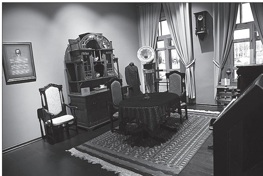
Рис. 2 Зал вернинского периода

Разделение истории города на этапы позволяет выявить особенности развития и формирования планировочной структуры города, проследить перемещение его центра, качественные изменения в застройке, благоустройстве и озеленении. В этот же период город Верный превращается в культурный, политический и торговый центр Жетысу с полиэтничным населением. В экспозиционном плане тема выделена пространственно в виде собирательного «образа» гостиной с интерьером XIX в., рабочего кабинета архитекторов А.П. Зенкова и П. Гурдэ.