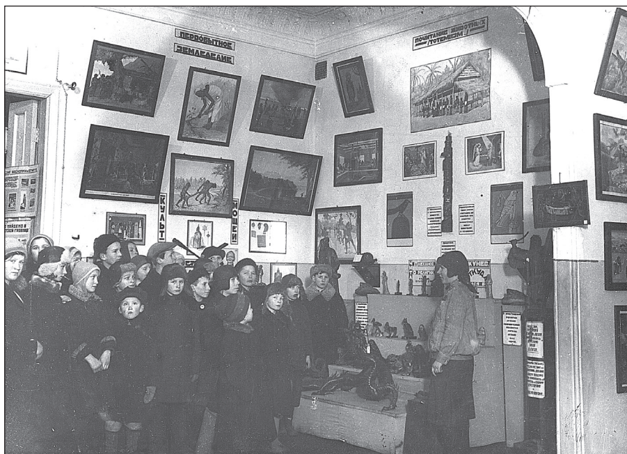
Рис. 3 Музей сравнительного изучения религий Ленинградского Губполитпросвета. 1924. ГМИР А-1349

В 1920-е гг. комплекс идей модерна приобретал все большую популярность, его последователи стремились к достижению всеобщего блага, отыскивая «настоящий путь к счастью человечества» — в данном случае через утверждение единого типа рациональности, частью которого было атеистическое мировоззрение, и не видели опасности в тотальности и бескомпромиссности своих интенций. Важно отметить, что эти люди принадлежали к той части советской культуры, которая обладала определенным престижем, к интеллектуальной и властной элите. С одной стороны, это позволяло поддерживаемым ими идеям быстрее распространяться 50 , с другой — давало возможность ориентироваться на их мнение при выстраивании официальных государственных стратегий. Без поддержки престижной культурой идеи модерна вряд ли могла, среди прочего, быть осуществлена государственная антирелигиозная политика.